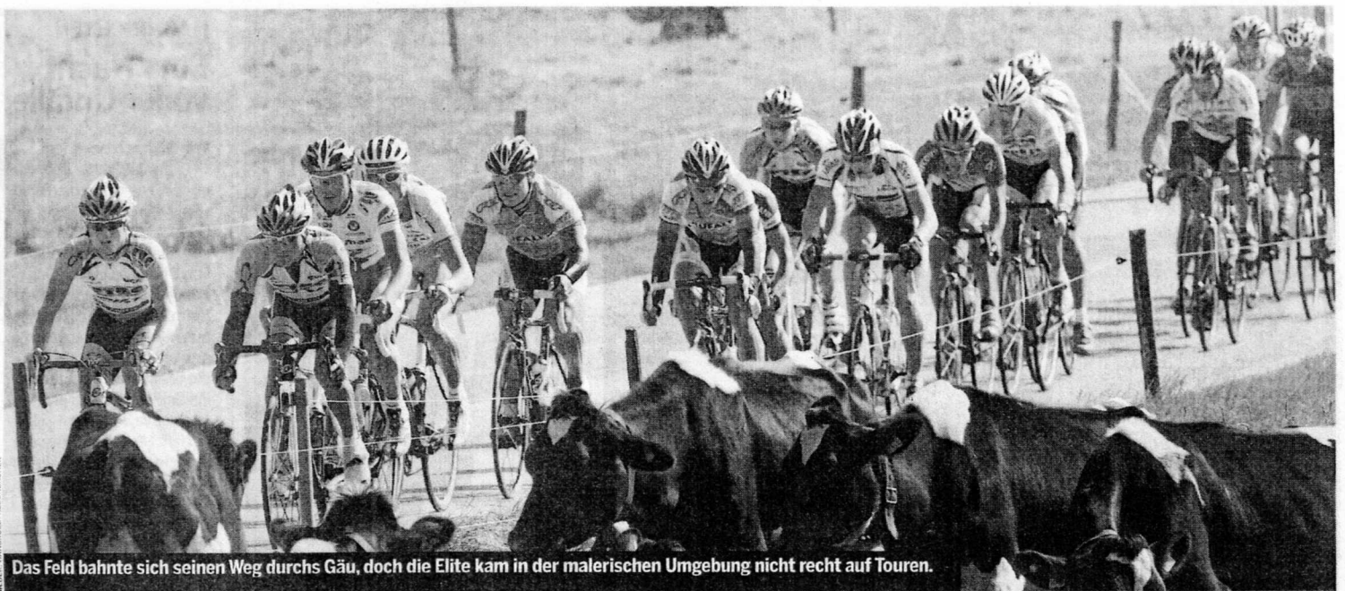
Das Feld bahnte sich seinen Weg durchs Gäu, doch die Elite kam in der malerischen Umgebung nicht recht auf Touren.